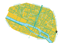
Paris (2022) zone à trafic limité