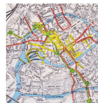
Strasbourg (1992) 4 boucles